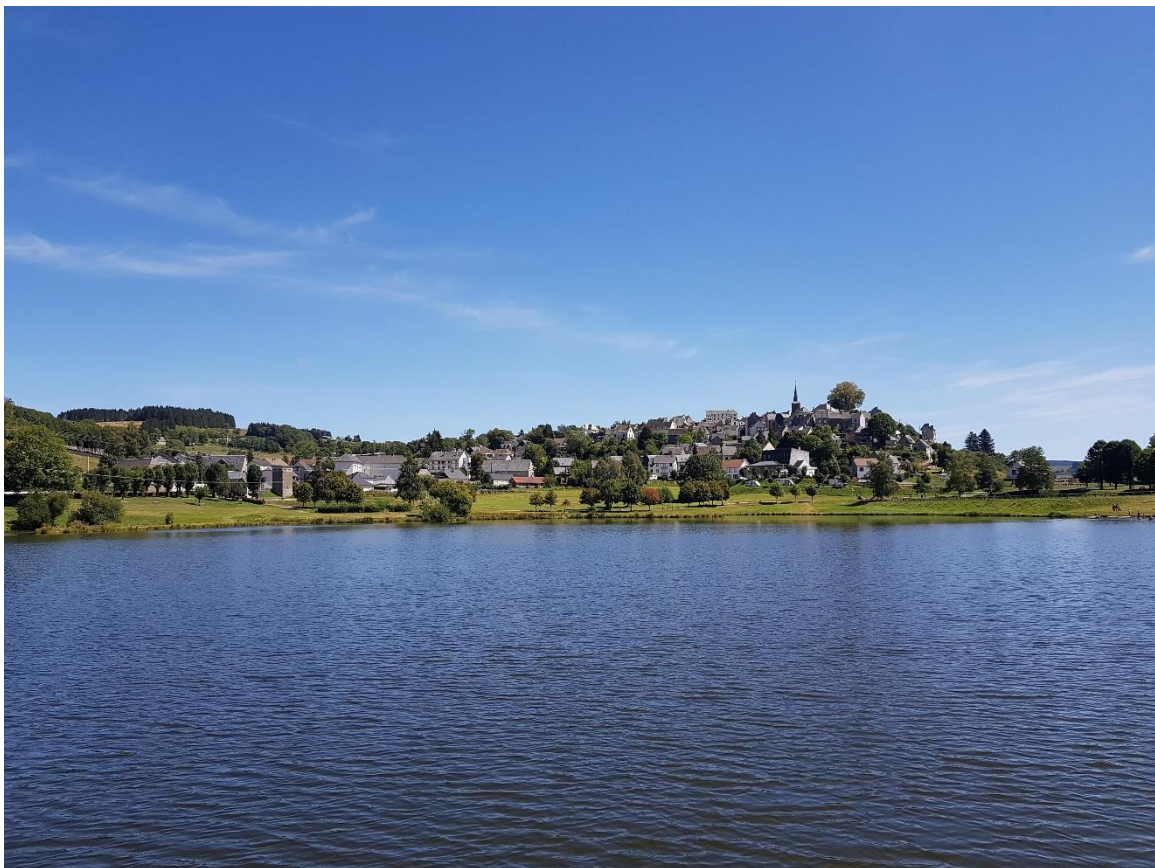
Lac de La Tour d'Auvergne

Rochefort-Montagne et La Tour d'Auvergne sont alimentées par des réseaux de chaleur bois. La filière bois-énergie est encore peu exploitée.