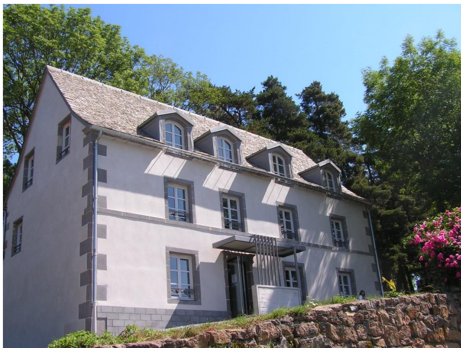
Maison Garenne - Saint-Sauves d'Auvergne

Les services culturels occupent des espaces publics dédiés : médiathèque à Tauves et Rochefort-Montagne avec un réseau intercommunal de bibliothèques qui se développe, ludothèque à Bagnols et Mazayes, salle de spectacle La Bascule à Tauves, Maison Garenne pour résidences d'artistes à Saint-Sauves d'Auvergne. La construction d'une saison culturelle intercommunale annuelle pour tous publics et scolaires, des expositions , des manifestations d'envergure, le soutien technique et financier aux associations, etc. sont autant d'activités proposés pour la population locale.