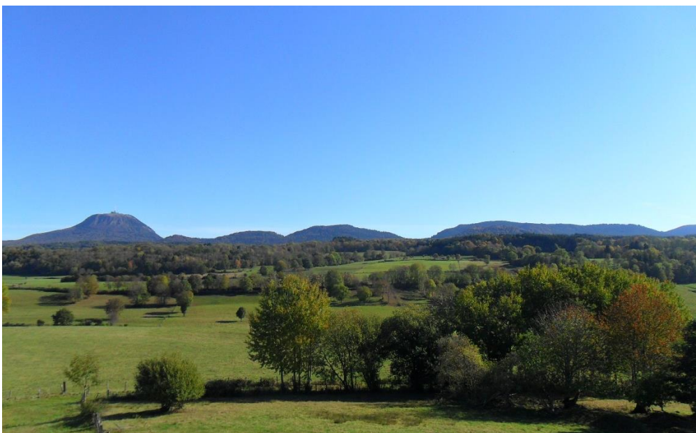
Chaîne des Puys - faille de Limagne - Patrimoine mondial de l'UNESCO

55 minutes sont aujourd'hui nécessaires pour se rendre, par la route, du nord au sud de ce territoire très étiré.