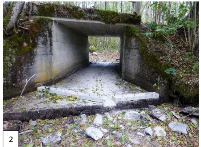
Figure 5 - Photos avant (1), pendant (2) et après (3) l'aménagement d'un radier pour rétablir la continuité écologique