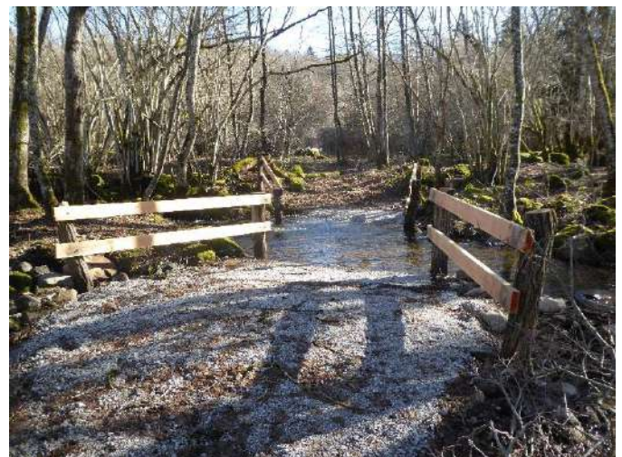
Figure 3 - Photos d'un passage à gué piétiné, avant et après travaux d'aménagement