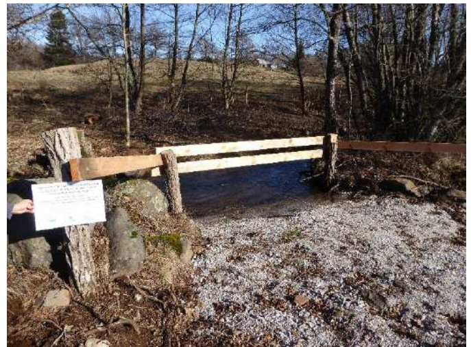
Figure 2 - Photos d'une berge piétinée, avant et après aménagement d'une descente empierrée pour l'abreuvement