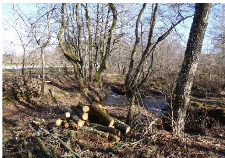
Figure 1 - Photo de la ripisylve après passage de l'entreprise sur le cours d'eau du Rigaud