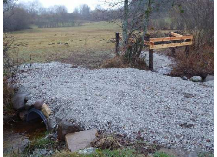
Figure 4 - Photos d'un passage gué piétiné, avant et après la pose d'une demi-buse