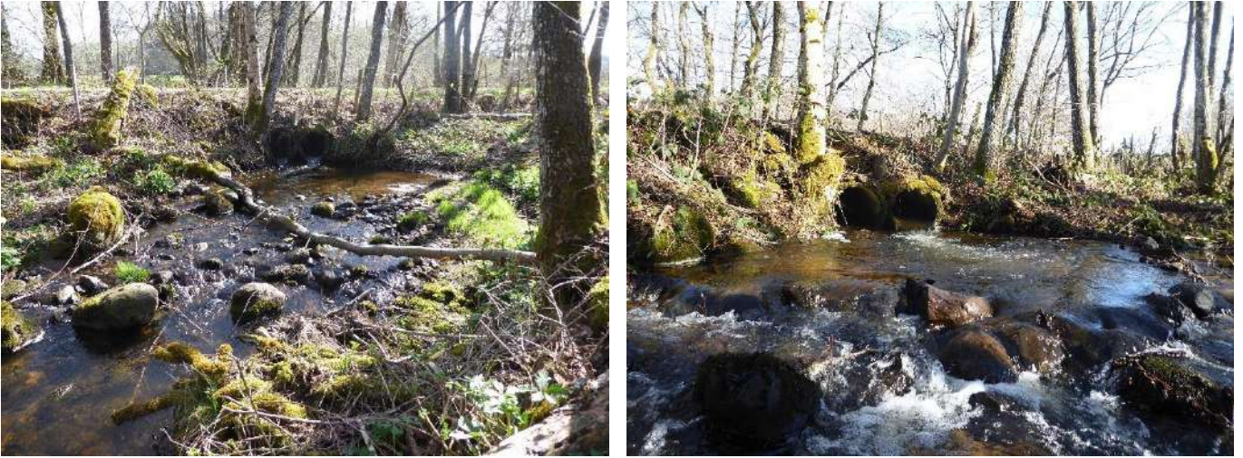
Figure 6 - Photos avant et après l'aménagement du pré-barrage pour rétablir la continuité écologique au niveau des deux buses

Le technicien rivière et un agent intercommunal ont aménagé en régie 2 radiers de pont et 1 pré-barrage en aval d'une buse (le Rigaud à Larodde).